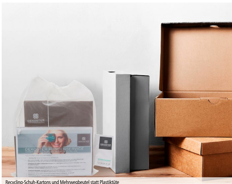
Recycling-Schuh-Kartons und Mehrwegbeutel statt Plastiktüte

2. Bestellungen werden nicht mehr mit Plastiktüten sondern mit einem waschbaren Mehrweg-Obst/Gemüsebeutel an Kundinnen und Kunden versendet. Auch unsere Schmuckboxen aus Karton können zur Lagerung und fachgerechter Aufbewahrung unserer Produkte verwendet werden.